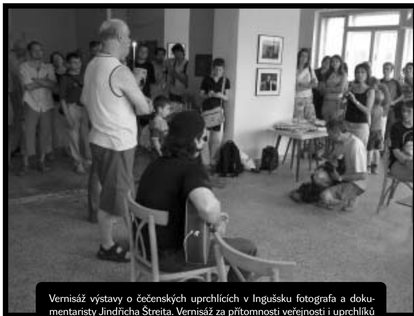
Vernisáž výstavy o čečenských uprchlících v Ingušsku fotografa a dokumentaristy Jindřicha Štreita. Vernisáž za přítomnosti veřejnosti i uprchlíků z pobytového střediska v Zastávce proběhla v červenci v Brně.

Třetí část našich aktivit se odehrává ve znamení úsilí o změnu azylové politiky v ČR. Jak jsme poznali na příkladu šedesáti čečenských žadatelů a žadatelek o azyl a bohužel stále poznáváme na dalších příkladech lidí ze všech koutů světa, praxe azylových úředníků je velmi restriktivní a ve svém důsledku až nelidská. Proto upozorňujeme na jednotlivé případy porušování lidských práv uprchlíků v ČR,