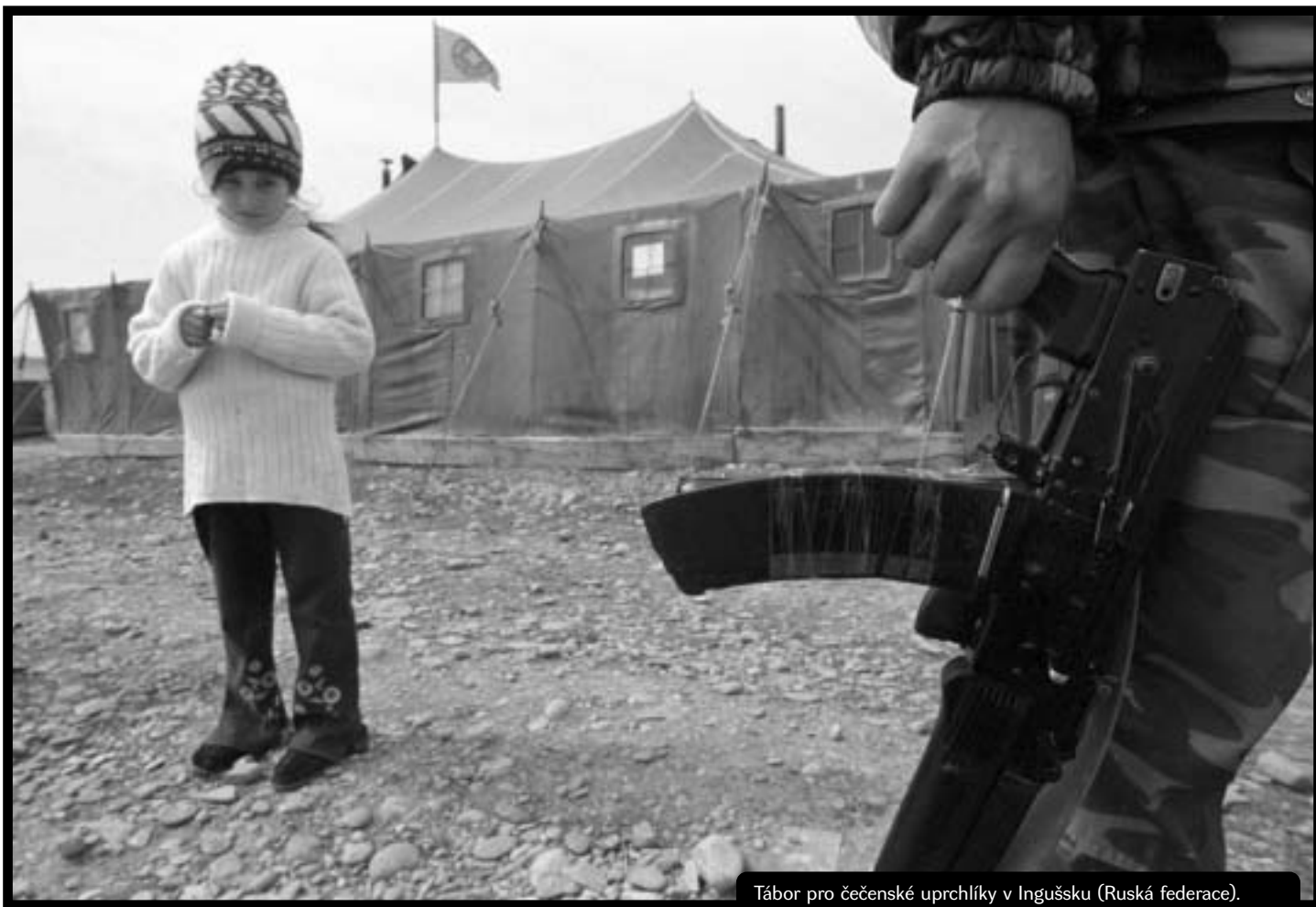
Tábor pro čečenské uprchlíky v Ingušsku (Ruská federace).